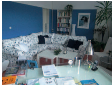
Layout: Katrin Bucksch, Agentur für Informationsdesign